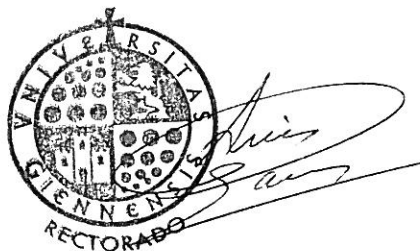
Fdo.: Luis Parras Guijosa